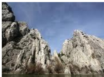
Слика: Демиркаписка Клисура

Клисурата е долга околу 19 км., и се наоѓа помеѓу Тиквешката котлина на северозапад и Бојмија на исток. Страните и се изградени од од модри шкрилци, преку кои лежат слоеви на модра крупна вар со мезозојска старост. Високи се до 1000 м. и се многу стрмни. Најстрмни се во камениот дел при влезот на Вардар во клисурата.