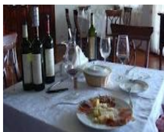
Слика: Национален ресторант во Демир Капија

Со самото тоа ќе се створат одлични услови за развој на туризмот, пред се : еко туризам, селски, планински туризам (со професионални лиценцирани водичи за таа работа), деловен туризам – организирање на разни деловни манифестации: деловен форум, научни и стручни предавања, промоции, семинари, мини саемски манифестации, конгреси и.т.н., со посебен акцент на вински туризам.