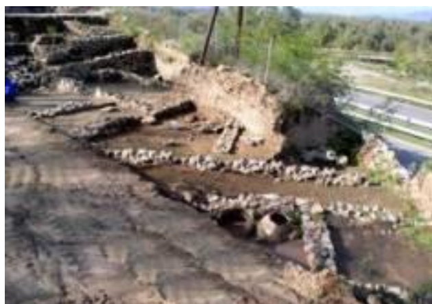
Остатоци од археолошки локалитет Вардарски рид

Природно богатство претставуваат Негорските Бањи како и археолошкиот локалитет Вардарски Рид, во близина на Гевгелија. Досега во него се откриени шест населби, една врз друга, во кои животот се одвивал од XIII до II век. Станува збор за старомакедонски населби кои потекнуваат од времето пред и по владеењето на Александар Македонски.