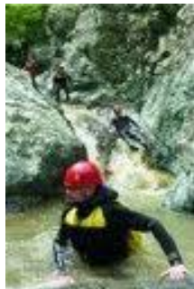
Слика : Кајак на дивни води на р.Вардар кај Демиркаписката клисура

Демир Капија има голем потенцијал за алтернативен туризам, бидејќи е богата со археолошки, спелолошки локалитети, има богатство на флора и фауна како и убавата клисура, но за да оваа област се развие потребно е да се испитаат можностите за кои и каков вид на туризам треба да се развие и промовира. Затоа се предлага изработка на една сеопфатна студија која ќе ги анализира потенцијалите и ќе предложи можни концепти за развој на некои видови на алтернативен туризам, како што е алпинизмот, ловниот, кајак на дивни води, риболовниот, историскиот, руралниот, вински, спортски и сл.