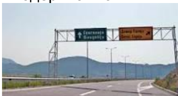
Слика :7 (Комуникација со други градови)

Низ долината на Вардар води најзначајниот пат на Среден Балкан, поврзувајќи го Подунавјето и Средна Европа со Егеј и копнена Грција. Во долното течение, долината на Вардар е стесната со 19 км долга клисура, која почнува кај Демир Капија, а завршува кај Удово. Најтесен и е северниот крај Просек. На тоа место Вардар ги просекол варовничките карпи на венецот Краставац, високи до 220 м. Карпите паѓаат вертикално во река, не оставајќи место за пат. Описот на тој пат низ Просек ни е сочуван од минатиот век, пред да се пробие железничката пруга и модерниот пат.