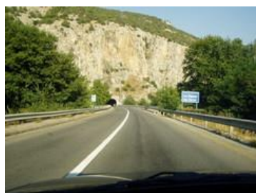
Слика :2 (Автопатот Е-75

За да се согледа влијанието на состојбата и развојот на сообраќајот врз туризмот неопходно е да се анализираат сите видови на сообраќај. Значи, освен патните правци, значајна за развојот на туризмот е и железничката пруга која поминува низ Гевгелија која во Скопје се поврзува со меѓународниот правец од Средна и Западна Европа до Солун.