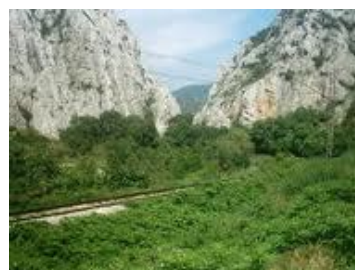
Слика: 3 Железничка линија

Железничкиот сообраќај низ Демир Капија добивал се поголемо значење, така што во поново време, по реконструкцијата, модернизацијата и електрификацијата тој има и меѓународно значење, особено железничката линија Белград- Скопје- Солун- Атина.