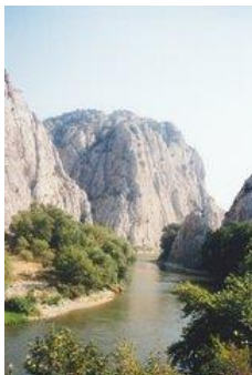
Слика : Реката Вардар кај Демиркаписката Клисура

Реката Вардар која е најголем и најзначаен водотек во нашата држава, има вкупно должина од 301 км (од изворот до македонско-грчката та граница), а низ Демир Капија изнесува должина од 24 км. Кај Демир Капија просечните годишни нејзини протоци изнесуваат 168 м 3 /сек. Максималните се 2380 м 3 /сек, а минималните се спуштаат и до 13 м 3 /сек.