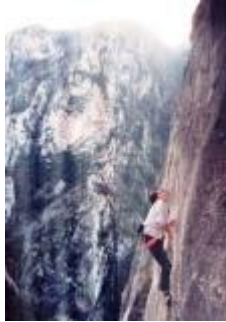
Слика : Алпинистички туризам на Демиркаписката Клисуре

Демир Капија има голем потенцијал за алтернативен туризам, бидејќи е богата со археолошки, спелолошки локалитети, има богатство на флора и фауна како и убавата клисура, но за да оваа област се развие потребно е да се испитаат можностите за кои и каков вид на туризам треба да се развие и промовира. Затоа се предлага изработка на една сеопфатна студија која ќе ги анализира потенцијалите и ќе предложи можни концепти за развој на некои видови на алтернативен туризам, како што е алпинизмот, ловниот, кајак на дивни води, риболовниот, историскиот, руралниот, вински, спортски и сл.