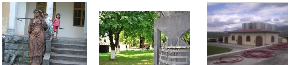
Слика: Винарија „Агропин“ - Демир Капија

Изградба на Винарија- ослонувајќи се на традицијата долга 80 год., во производство на грозје и инзворедно квалитетни вина, главната цел е да се продолжи традицијата која кралот Александар Караѓорѓевиќ ја започнал далечната 1928 год во Демир Капија со капацитет од 5 милиони литри да понуди на европскиот пазар, па и пошироко во светот, вина со висок квалитет и препознатлив квалитет KINGS WINES, како и управна зграда во која ќе бидат сместени: