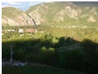
Слика : Вегетација Д.Капија

Природните услови се сосема различни на источните, западните, и северните падини. На источните падини под гребенот кај Голем и Мал Кростоец, падината вертикално се руши по 100-200 м, а во карбонатните отсеци има повеќе пештери. Под нив се наоѓаат смирени сипари врз кој се развива почва од типот варовнично-доломитни црници. Надолу спрема Клисурската Река наклонот на теренот се намалува и се развиваат кафеави почви врз варовник. На подлога од дијабаз почвите се каменити од типот ранкери. Теренот е сиромашен со вода. Освен Клисурската река, други постојани водотеци нема, но има осум извори со питка вода на различни н.в. Карактеристично е што во височините на главниот гребен честопати на есен се појавува магла. Теренот е засолнет од ветрови.