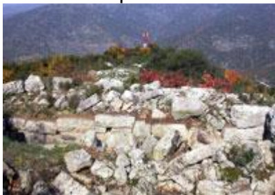
Слика :6 Античка населба-Просек

Клисуре, словенското име Просек кое се задржало до средниот век, па покасно се до земјотресот 1931 го носела името Бања (Демир Капија лежи на подземно езеро со термална вода), и на крај турскиот назив Демир Капија во превод Железна врата.