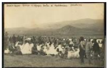
Слика: Демир Капија во минатото

Најзначајниот дел од тој период всушност е периодот на Втората Балканска Војна кога за Демир Капија интерес покажува српската кралска династија Караѓорѓевиќ. Со воспоставувањето на новата власт дошло до значајни промени на населбата Демир Капија која добива статус на Општина. Обновена била железничката станица, изградена нова зграда на пошта и отворени неколку трговски друштва, хотел и болница, кој на населбата и дале нов облик на градско обележје. Коренити промени на економски план во Демир Капија, настануваат после купувањето на земја, од страна на кралот Александар I Караѓорѓевиќ, и негово претворање во приватен имот.