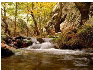
Слика : Реката Бошава кај Д.Капија

Реката Вардар која е најголем и најзначаен водотек во нашата држава, има вкупно должина од 301 км (од изворот до македонско-грчката та граница), а низ Демир Капија изнесува должина од 24 км. Кај Демир Капија просечните годишни нејзини протоци изнесуваат 168 м 3 /сек. Максималните се 2380 м 3 /сек, а минималните се спуштаат и до 13 м 3 /сек.