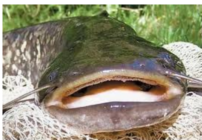
Слика : Реката Бошава кај Д.Капија

уживаат во риболовот. Големiot интерес за спортски риболов најмногу ја развивала страста на бројните риболовци поради изворедно богатиот и квалитетен фонд на риби во Демиркапискиот регион. Најголема атракција и задоволство на секој спортски риболовец е уловот на поточната пастрмка на планинската река Дошница, како и сомот и друга речна риба во река Вардар. Има повеќе видови на риба и тоа: сом, крап, мрена, клен, бојник, јагула, белвица, карас, попадика, пастрмка, кркуш, мрена и др.