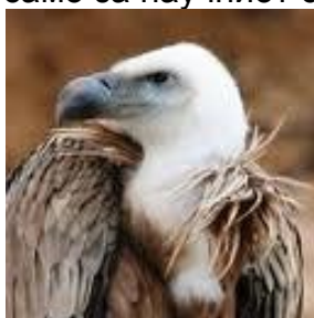
Слика : Белоглав орел кај Д.Капија

Диверзитет на животинскиот свет кај Демиркапискиот регион, исто така се одликува со инзворедно богатство на безрбетни и рбетни таксони. Клисурата Демир Капија и поширокото подрачје на Демир Капија се долго познати како извонреден орнитолошки локалитет на кој може да се сретнат голем број ретки и загрозени птици грабливки и воопшто птици во Р.Македонија, Балканот и Европа (Doflein 1921, Stresemann 1920). Посебно се истакнуваат: белоглавиот мршојадец ( gyps fulvus ), египетски мршојадец ( neophron percnopterus ), златен орел ( aquila chrysaetos ), орел змијар ( circus gallicus ), лисест глупчар ( buteo rufinus ), разни соколи ( falco peregrinus , Falco naumanni ), како и други ретки видови птици. Животинскиот свет се смета како основа за развој на ловниот и риболовиот туризам, меѓутоа во поново потенцијалните туристи како што споменаваме ги интересира и биолошката разновидност, што порано беше карактеристично само за научниот свет.