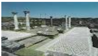
Антички град Стоби

Виа Игнатиа. Ваквата местоположба овозможила Стоби да биде значаен воен, стратегиски економски и културен центар.