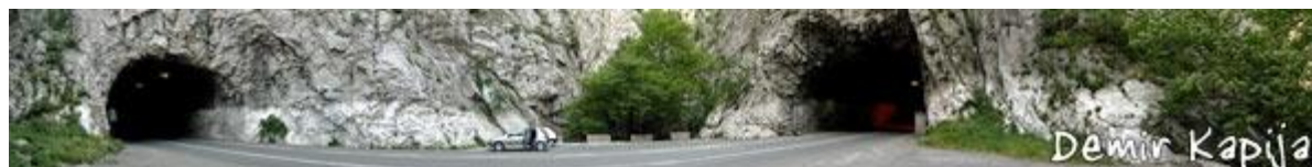
Слика:4 (Тунелите кај Демиркаписката Клисура)

Железничкиот сообраќај низ Демир Капија добивал се поголемо значење, така што во поново време, по реконструкцијата, модернизацијата и електрификацијата тој има и меѓународно значење, особено железничката линија Белград- Скопје- Солун- Атина.